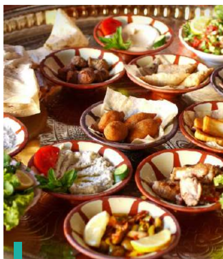
Almuerzo tradicional en la plaza del monasterio Bchaaleh.