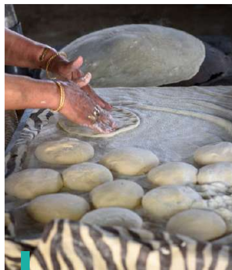
Actividad culinaria en Beirut llamada "Kitchen Lab".