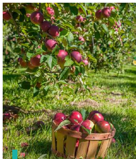
Tour-actividad de recogida de manzanas en Bchaaleh.