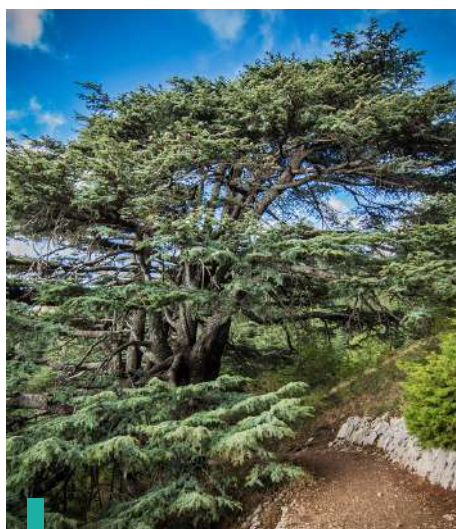
Paseo por la Reserva natural de Cedros en el bosque de Barouk.