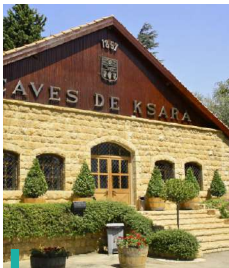
Visita a la antigua Bodega Ksara y cata de sus vinos.