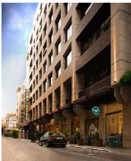
BEIRUT Gems Hotel o similar.