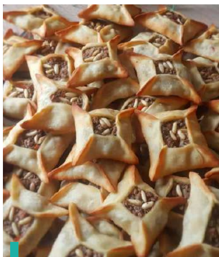
Degustación de los típicos dulces árabes en Trípoli.