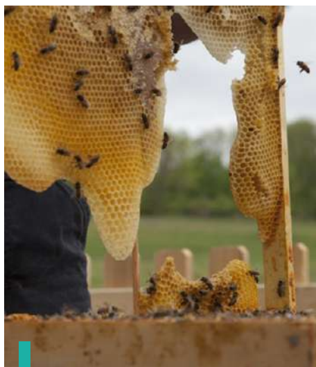
Conocer la actividad apícola de Ehme.