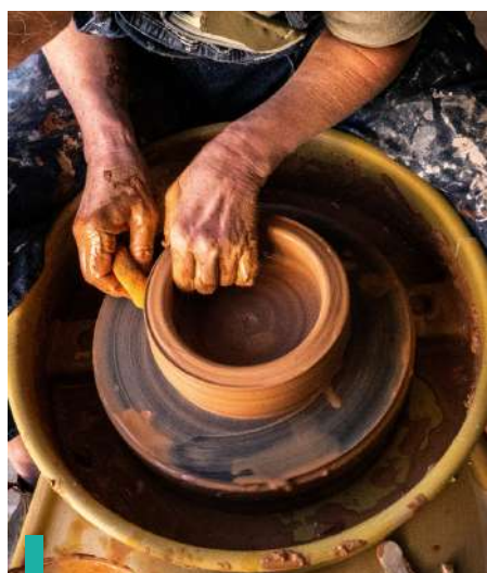
Experiencia de alfarería en Bchaaleh.