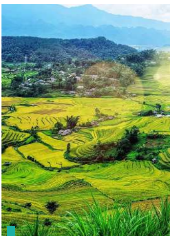
Visita y trekking en Sa Pa con vistas panorámicas.