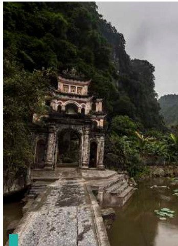
Visita de la Bich Dong Pagoda en bicicleta.