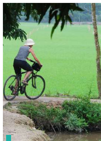
Paseo en bicicleta por la isla de Tân Phong.