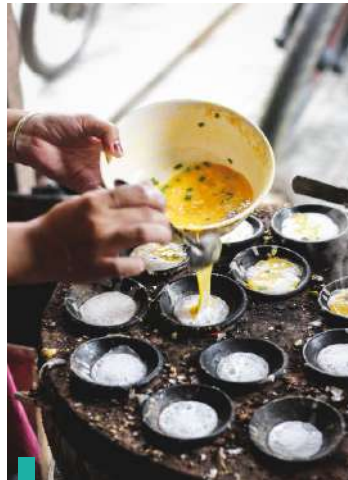
Celebración y cena de fin de año en el hotel.