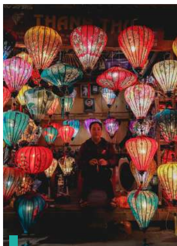
Creación de una linterna vietnamita tradicional.