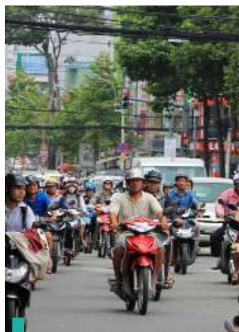
Conocer el corazón de Saigon en moto.