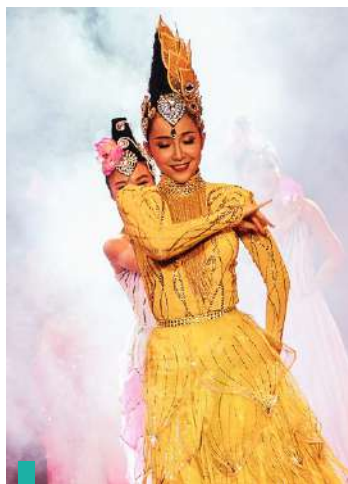
Espectáculo de música folclórica.