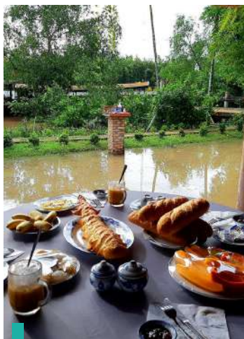
Noche en casa familiar Út Trinh y cocinar platos típicos.