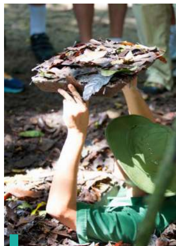
Paseo por un túnel subterráneo real en Cu Chi.