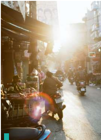
Recorrer el casco antiguo de Hanoi en moto Minks.