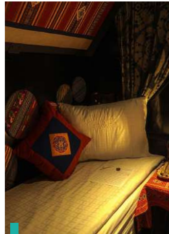
Mágica noche a bordo del Chapa Express.