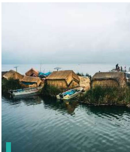
Sube a bordo de una lancha rápida en el Lago Titicaca.