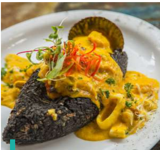
Degustación de los almuezos especiales locales.