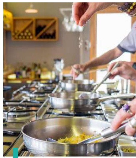
Participa en una experiencia gastronómica en Cusco.