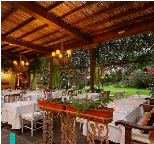
Disfruta de un exclusivo almuerzo en los jardines del Museo Larco.