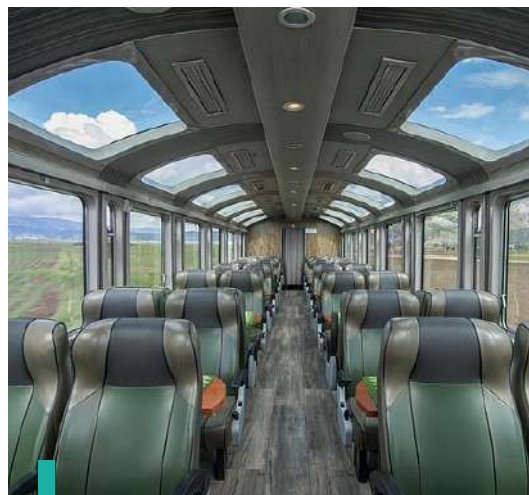
Admirar las vistas panorámicas de Perú a bordo del tren Vistadome.