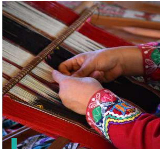
Aprende del arte de las tejedoras en el centro textil de Chinchero.