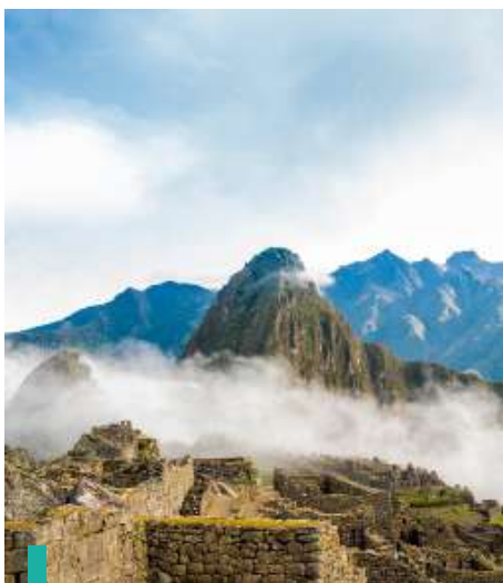
Visita el impresionante lugar sagrado de Machu Picchu.